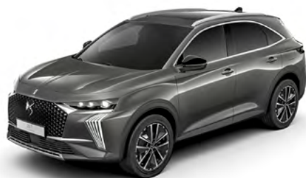
Sivá TITAN (M)