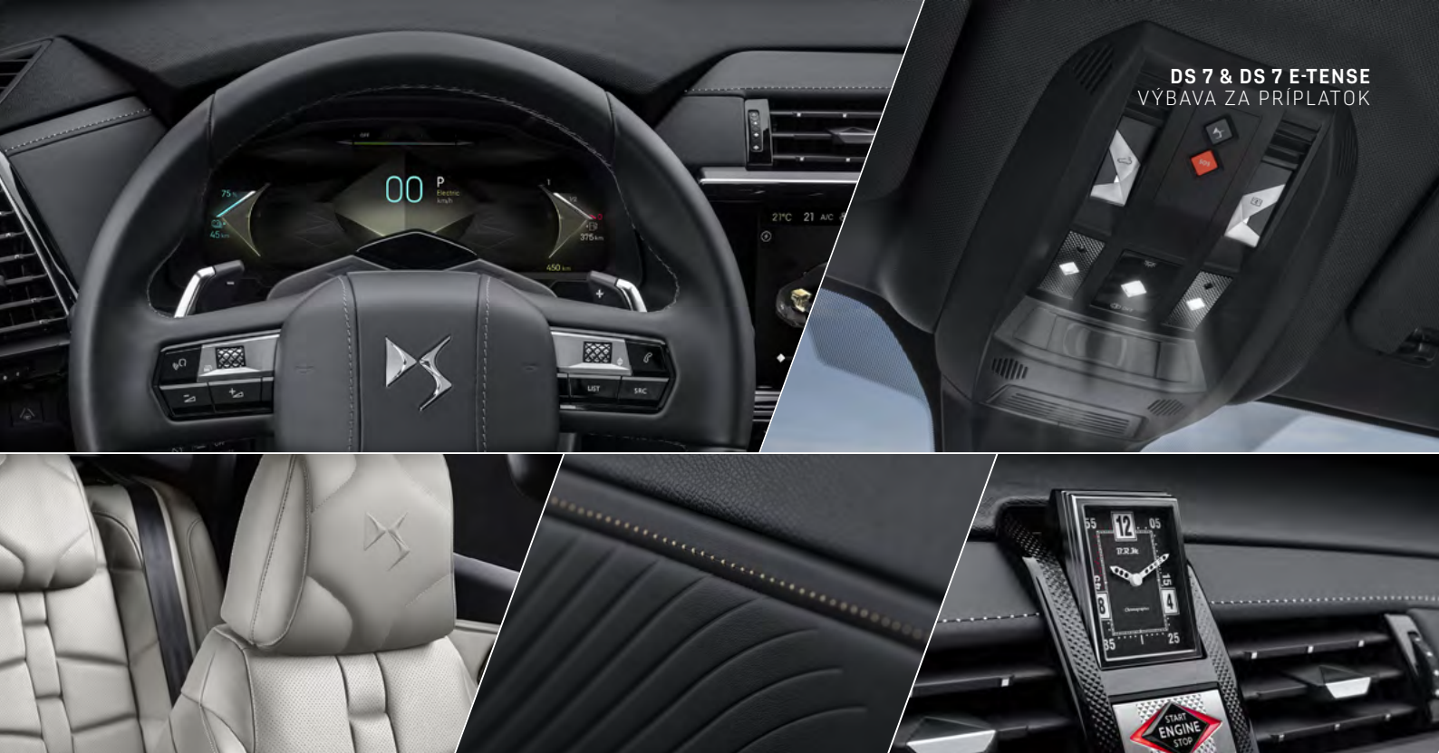
DS 7 & DS 7 E-TENSE VÝBAVA ZA PRÍPLATOK