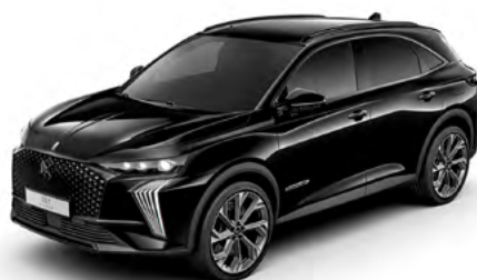
Čierna PERLA NERA (P)