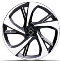
Zliatinové disky 20" TOKYO (ZHFK) voliteľná výbava pre Performance Line+, Rivoli a Opera (okrem E-TENSE 360 k 4x4)