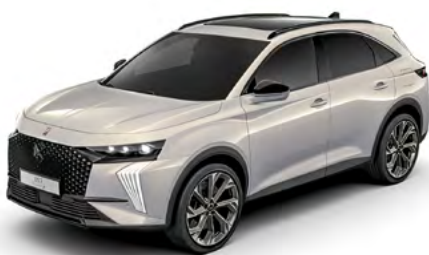
Sivá CRISTAL PEARL (P)