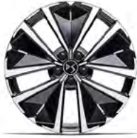
Zliatinové disky 19" EDINBURGH (ZHWO) v sérii pre Bastille, Rivoli, Opera / voliteľná výbava pre Performance line+ BlueHDi 130