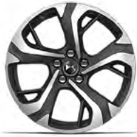
Zliatinové disky 18" VIENNA (ZHVV) v sérii pre Bastille BlueHDi 130