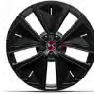
Zliatinové disky 19" SILVERSTONE (ZHW1) v sérii pre Performance Line+