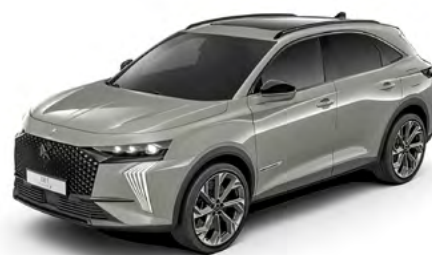
Sivá LAQUÉ (M)