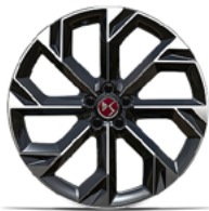
Zliatinové disky 21" BROOKLYN (ZHYA) v sérii pre E-TENSE 4x4 360k